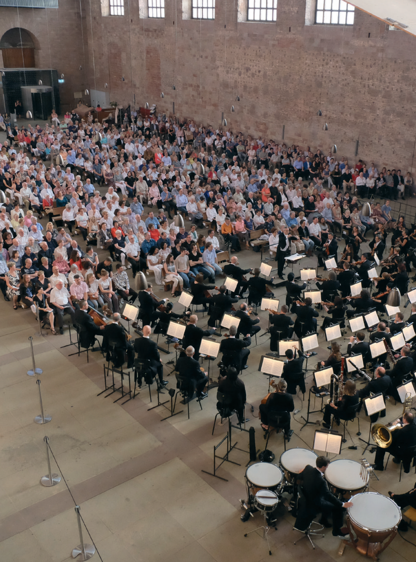
100 Jahre Philharmonisches Orchester Trier